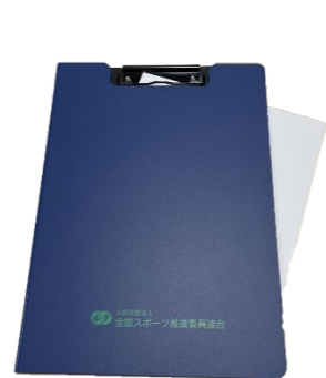
クリップファイル 1,000円