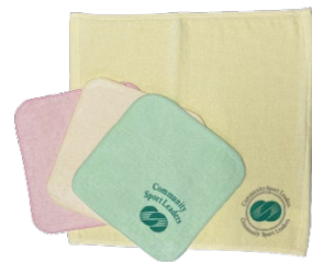
ハンドタオル（イエロー） 610円