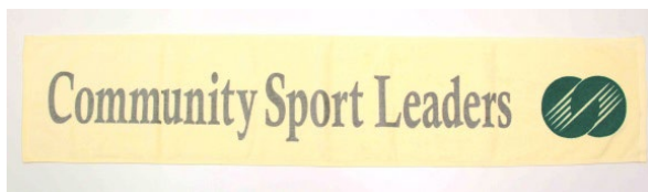
マフラータオル（イエロー） 1,020円