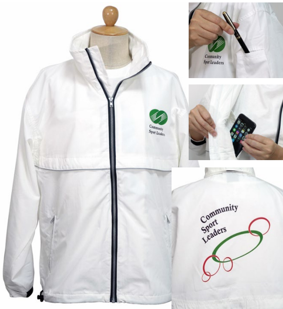
ジャンパー（ホワイト・男女兼用） 7,200円