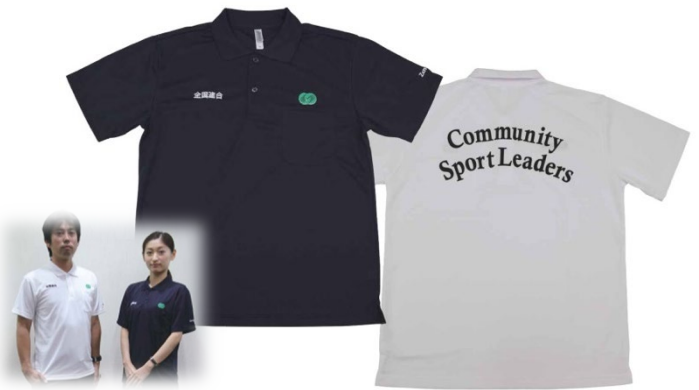
ポロシャツ（男女兼用） 3,500円